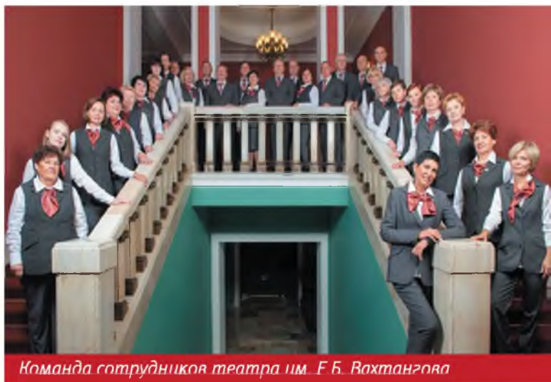
Команда сотрудников театра им. Ф.Б. Хохмантова

Основное правило на любом школьном мероприятии – вежливость и чистота!