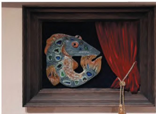
Щука – символ Театрального института

В зрительном зале нужно задрапировать окна шторами, в нужной степени применить затемнение. Стены в актовом зале можно украсить стильно оформленными атрибутами театра: всевозможные маски, веера, шляпки и пр. Оформление зала не должно быть пестрым, разнокалиберным, аляповатым. Учитывая, что оформление возможно будет использовано не раз, разумно обратиться за помощью к учителю по изобразительному искусству или к знающему родителю.